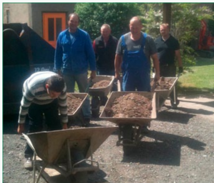
Ehrenamtliche Helfer bei der Sanierung des Gemeindehauses. Ohne diese Unterstützung hätte das Vorhaben nicht begonnen werden können.

Rund 82.000 Euro hat die evangelische Kirchgemeinde Stotternheim im vergangenen Jahr für die gründliche Sanierung ihres alten Gemeindehauses aufgewandt, Eigenleistungen eingeschlossen. Das alte Gebäude, dessen Geschichte bis ins Jahr 1872 zurückreicht, dient dem Mutter-und-Kind-Kreis, den Chören, der Jungen Gemeinde und der Jungschar als Versammlungsraum. Abgeschlossen ist