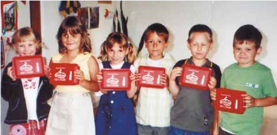
Stolz präsentieren die Mädchen und Jungen ihre Frühstücksbox für den baldigen Schulbesuch.