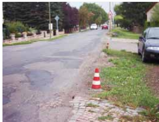
Schnappschuss an der Einfahrt in Richtung Schule

Eine verstärkte Verkehrsüberwachung und -kontrolle im Bereich der Mittelhäuser Straße wurde auf Anfrage bei der Thüringer Polizeidirektion durch